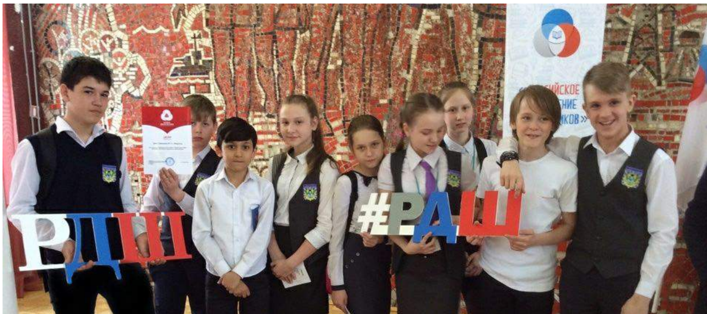
Наши первые достижения в Российском движении школьников. gimnaziazvuk.ucoz.com